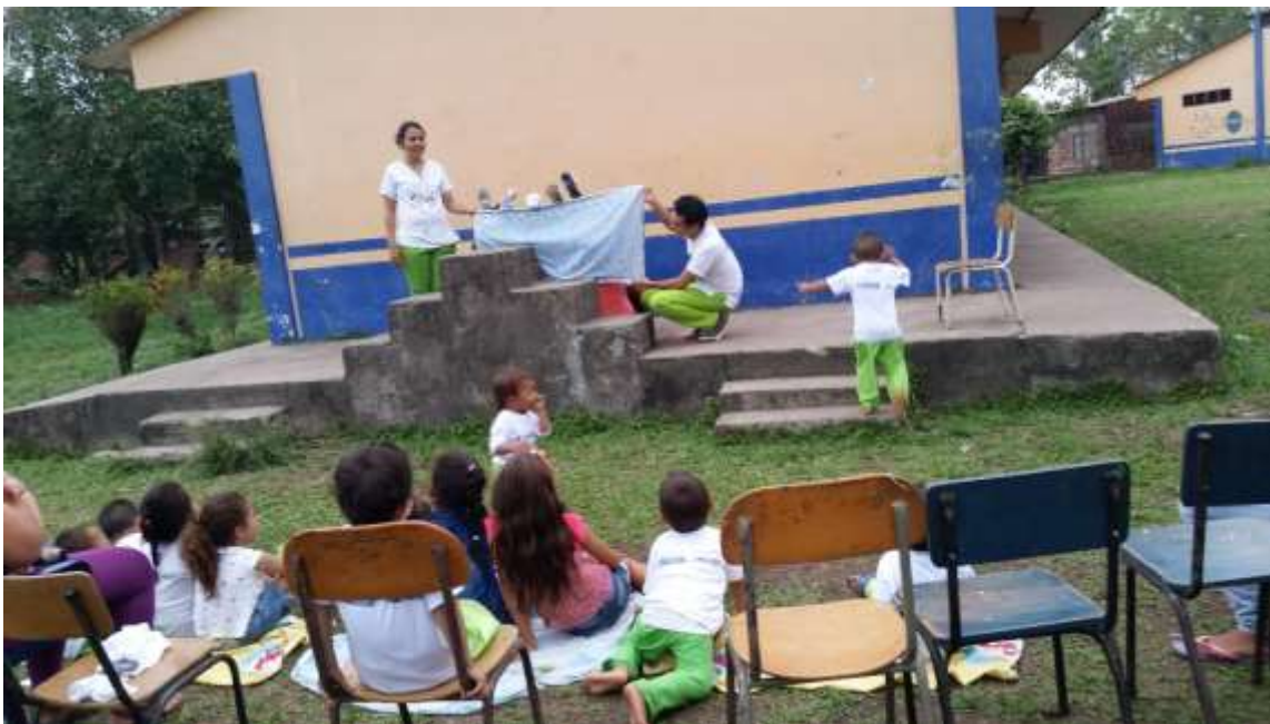
Dramatizado de canciones infantiles por las madres