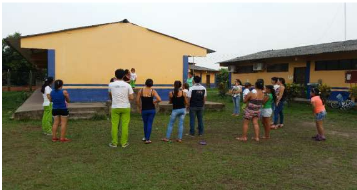
Madres cantando con sus hijos