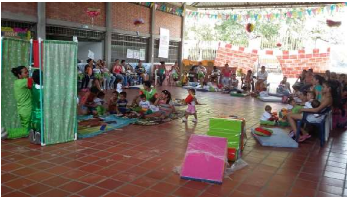
Narración de cuentos con títeres