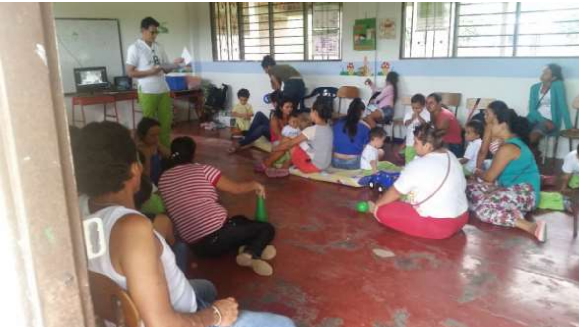
Lectura de cuentos