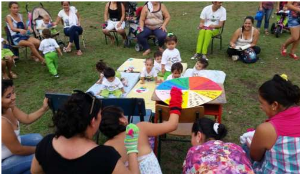
Madres dramatizando cuentos