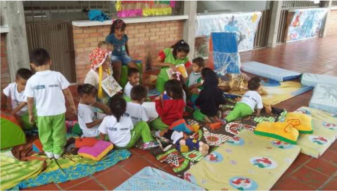
Lectura de cuentos con imágenes