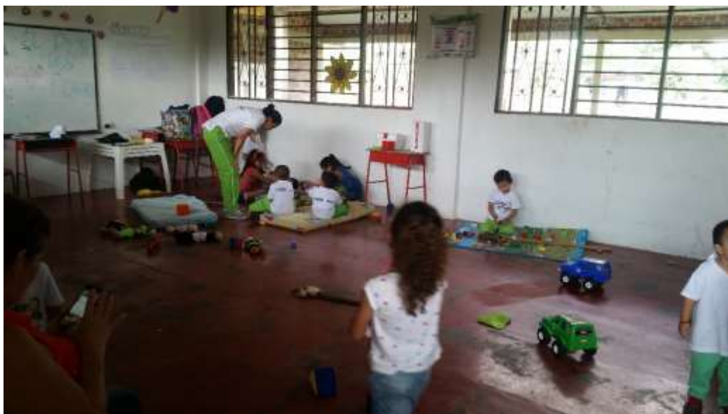
Juego de roles (niños jugando al médico)