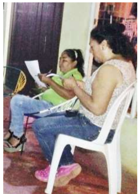
Figura N°2 Soporte fotográfico (cuatro figuras)