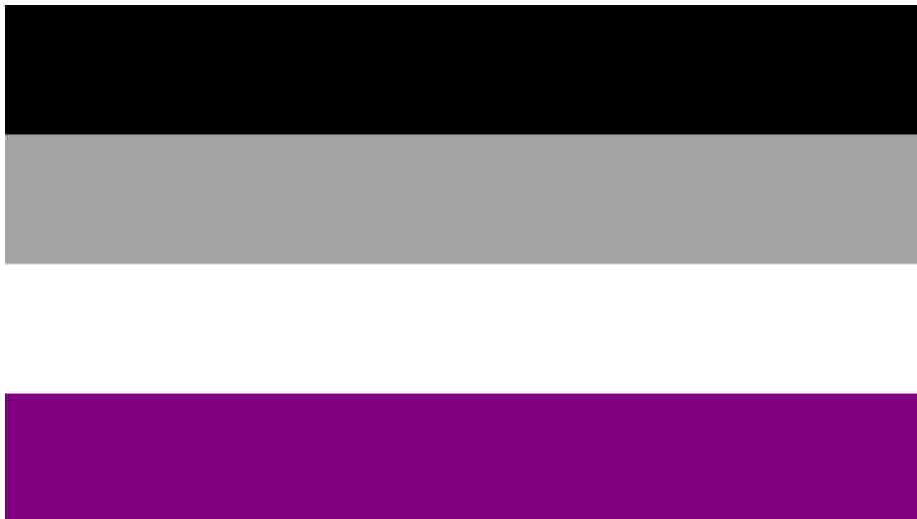
Gráfica 2: Bandera de la Asexualidad

Como detallan Blanco y Tello en su trabajo de investigación la comunidad online AVEN contiene distintas secciones, dentro de las cuales se ubican: Preguntas frecuentes, proyectos, comunidad, red social, foro, grupos, radio, enlaces de contacto, entre otros, además de la enciclopedia denominada “AsexualpediA” que contiene la mayor cantidad sobre la asexualidad disponible actualmente en la red. De igual manera se ha diseñado una bandera multicolor que representa a la comunidad asexual como medio para establecer una mayor visibilidad de la comunidad a nivel social, la cual se muestra a continuación: