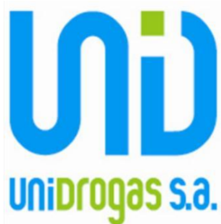
Figura N° 1 Logotipo de Unidrogas S.A