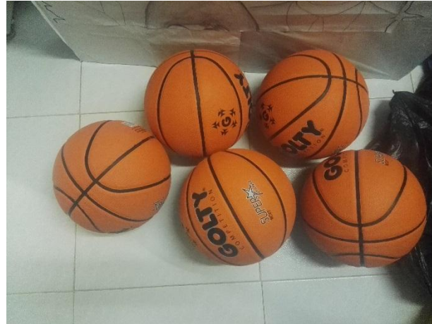
Balones de baloncesto