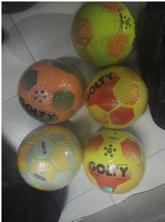
Balones de microfútbol