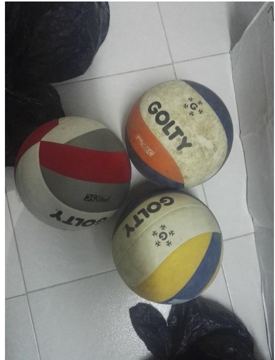
Balones de voleibol